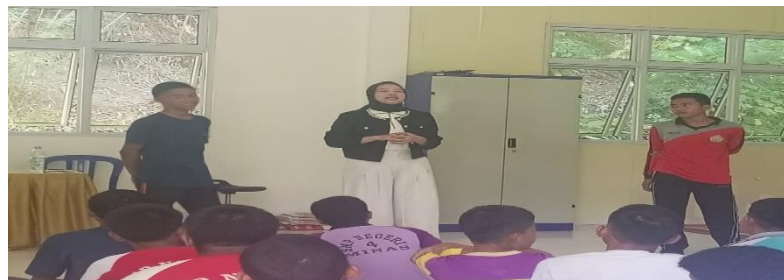
Gambar 4. Pemateri selain menjelaskan juga mengajukan pertanyaan dan pendapat kepada siswa SMK 1 Minas mengenai Kesetaraan Gender

Dalam gambar 4, pemateri wanita berdiri di tengah, di antara dua siswa laki-laki yang berdiri. Ekspresi mereka menunjukkan bahwa mereka sedang berinteraksi. Salah satu siswa, yang berdiri di sisi kiri, tampak tersenyum, sementara siswa lain yang mengenakan kaus merah dan abu-abu di sisi kanan tampak mendengarkan dengan serius. Sesi ini menekankan pentingnya partisipasi aktif dalam proses belajar dalam penelitian Edwar, (2022). Dengan mengajukan pertanyaan dan meminta pendapat, pemateri mendorong para siswa untuk berpikir kritis tentang topik kesetaraan gender. Hal ini juga memungkinkan mereka untuk dan memperdalam pemahaman mereka sendiri, daripada hanya menerima informasi menyampaikan sudut pandang mereka secara pasif. Interaksi ini menciptakan suasana yang dinamis dan inklusif, di mana setiap siswa merasa suaranya dihargai.