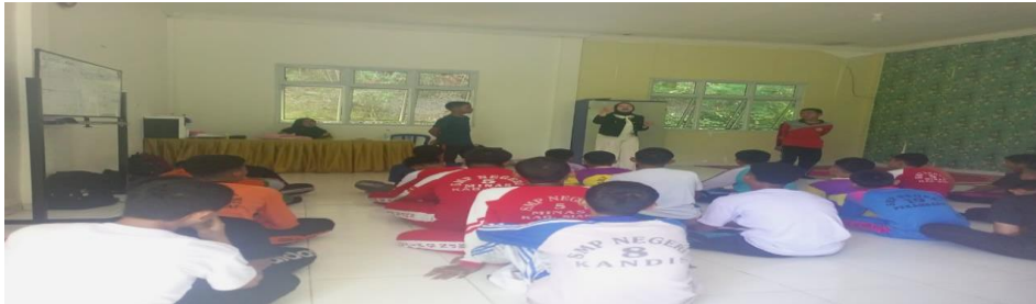
Gambar 3. Pada sesi kedua, materi kesetaraan gender disampaikan tidak hanya kepada siswi, tetapi juga kepada siswa.

gender di kalangan siswa, guru, dan tenaga kependidikan, tetapi juga merangsang perubahan perilaku, pola komunikasi yang empatik, serta penerapan kebijakan sekolah yang lebih inklusif dan responsif terhadap keluhan. Keberhasilan program tergambar dari sebagaimana di sampaikan oleh Fernando Fernando dkk , (2024) Dari ruang diskusi yang aman, peningkatan partisipasi berbagai pihak dalam pengambilan keputusan, hingga budaya evaluasi diri berkelanjutan. Melibatkan orang tua dan komunitas memperkuat dukungan eksternal, memperluas jaringan perlindungan, dan memastikan dampak positif berkelanjutan bagi iklim belajar yang adil, aman, dan menghormati martabat semua warga sekolah.