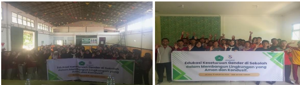
Gambar 5. Dalam Sesi di akhir acara Pelaksanaan Pengabdian Kepada Masyarakat kami Tim PKM Fakultas Ilmu Administrasi Universitas Lancang Kuning melakukan sesi foto bersama dengan guru dan juga siswa dan siswi SMK 1 Minas Kabupaten Siak.

Dalam sesi di akhir acara pengabdian kepada masyarakat melakukan sesi foto bersama yang dimana dalam hal ini dilakukan dua sesi dengan tempat yang berbeda. Yang pertama itu sesi foto bersama dengan para siswi perempuan. Sama seperti siswa, mereka juga terlihat antusias dengan ekspresi ceria dan pose yang sama. Ruangan yang lebih besar, dihiasi dengan bendera-bendera kecil, memberikan kesan acara yang sukses dan berkesan. Yang kedua sesi foto bersama dengan para siswa laki-laki. Mereka semua terlihat ceria, tersenyum, dan mengangkat tangan, menunjukkan suasana yang positif dan semangat setelah acara selesai. Sebuah spanduk besar bertuliskan "Edukasi Kesetaraan Gender di Sekolah dalam Membangun Lingkungan yang Aman dan Kondusif" menjadi latar belakang utama, mempertegas fokus dari kegiatan tersebut.