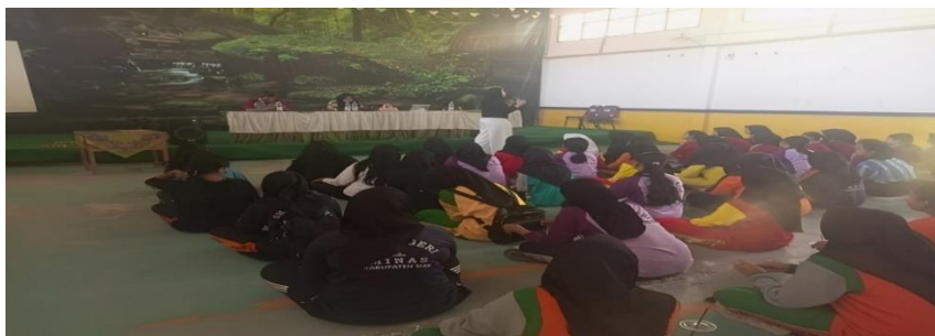
Gambar 2. Pemateri yang Sedang Meyampaikan tentang Pentingnya Pemahaman Kesetaraan Gender kepada Siwi dan juga Siswa di SMK 1 Minas.

Acara ini mengajak siswa memahami pentingnya perlakuan setara antara laki-laki dan perempuan, sehingga diskriminasi dan kekerasan berkurang, suasana belajar menjadi positif, dan inklusif bagi semua siswa. Kegiatan ini menekankan bahwa pendidikan meliputi pembangunan karakter melalui norma adil, saling menghormati, dan empati dalam interaksi di lingkungan sekolah. Juga sependapat dengan yang disampaikan sebelumnya dikatan juga oleh Herliah dkk , (2024) edukasi tentang kesetaraan gender di usia sekolah kejuruan menjadi sangat relev karena para peserta kelak memasuki dunia kerja. Dengan pemahaman yang lebih baik tentang hak, batasan pribadi, dan tanggung jawab sosial, mereka siap berkontribusi secara profesional tanpa melanggar stereotipe atau praktik tidak adil. Pengenalan konsep ini sejak dini diharapkan mempercepat pembentukan budaya kerja yang inklusif, menghargai keragaman, dan mendorong partisipasi setara dalam semua aspek pendidikan maupun karier masa depan.