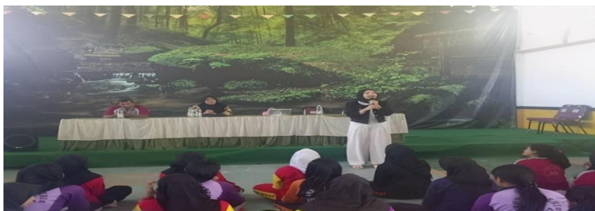
Gambar 1. Kegiatan Edukasi Kepada siswi SMK 1 Minas

Upaya perbaikan ke depan akan difokuskan pada penyempurnaan materi pembelajaran yang relevan dengan dinamika lokal Kabupaten Siak, sehingga konten edukasi kesetaraan gender semakin kontekstual, praktis, dan mudah dipahami oleh semua peserta didik. Selain itu dalam penyampaian Nasriyah, (2024) peningkatan fasilitas ruang aman akan terus diupayakan untuk memastikan lingkungan diskusi yang bebas dari intimidasi serta perlindungan bagi setiap warga sekolah saat berbagi pengalaman dan pandangan. menyampaikan pendapat bahwa Wahyuni, (2024) perluasan jaringan kerja sama dengan organisasi perlindungan anak dan komunitas setempat juga akan diprioritaskan untuk memperluas dukungan eksternal, memperkuat mekanisme pelaporan keluhan, dan memperkaya sumber daya serta akses terhadap layanan pendukung, sehingga dampak positif program ini dapat terjaga secara berkelanjutan dan meluas ke berbagai lintas pihak terkait.